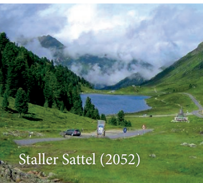
Staller Sattel (2052)

Hotel Wiedenhofer Terento – Bruneck – Niederrasen – Antholz Obertal – Staller Sattel (2052) – St. Veit – St. Johann – Lienz – Thal – Strassen – Innichen – Welsberg – Perca – Bruneck – Chienes – Terento Hotel Wiedenhofer