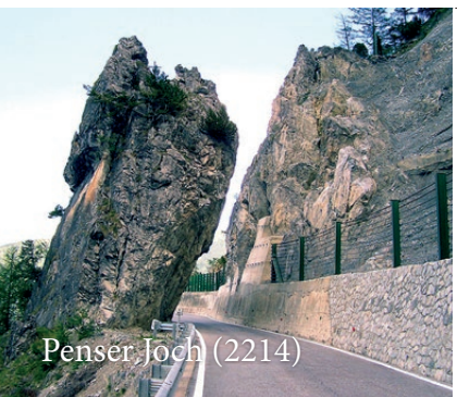
Penser Joch (2214)

Hotel Wiedenhofer Terento – Montana – Badia Abtei – Colfosco – Grödner Joch (2121) – Pso. Sella (2240) – Canazei – Mazzin – Vigo di Fassa – Karerpass (1745) – Nigerpass (1688) – Tires – Rittenpass (1213) – Sarentino – Corvara – Penser Joch (2214) – Sterzing – Mezzaselva – Mühlbach – Terento Hotel Wiedenhofer