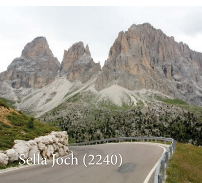
Sella Joch (2240)

Hotel Wiedenhofer Terento – Bruneck – Welsberg – Niederdorf – Carbonin – Pso. Tre Croci (1809) – Cortina d'Ampezzo – Pso. Giau (2230) – Pso. S. Lucia (1500) – Pietore – Pso. Fedaja (2057) – Canazei – Pso. Sella (2240) – Grödner Joch (2121) – La Villa – Badia Abtei – Rina – Montana – Chienes – Terento Hotel Wiedenhofer