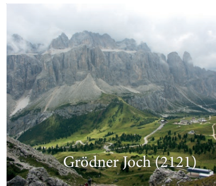
Grödner Joch (2121)

Hotel Wiedenhofer Terento – Montana – Pederöa – Badia Abtei – La Villa – Colfosco – Grödner Joch (2121) – Wolkenstein – St. Ulrich – Panidersattel (1442) – Ponte Gardena – Klausen – Brixen – Mühlbach – Terento Hotel Wiedenhofer