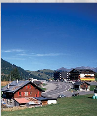
Col des Mosses

●●● ab Spiez – Interlaken – Meiringen – Innertkirchen – Grimsel-Pass (2165 m) – Münster